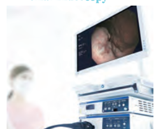
Hi-Vision Gastrointestinal Endoscopy